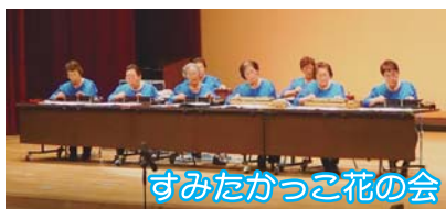
すみたかっこ花の会