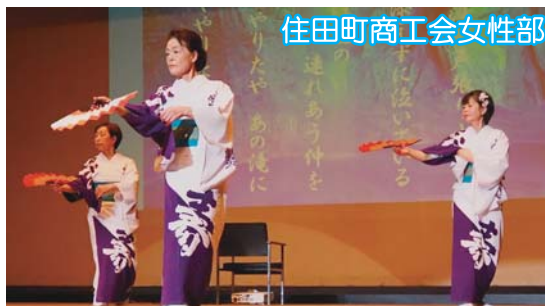
住田町商工会女性部