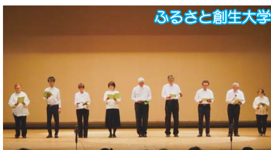
ふるさと創生大学