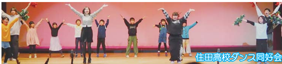
住田高校ダンス同好会