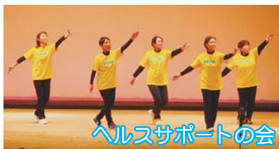
ヘルスサポートの会