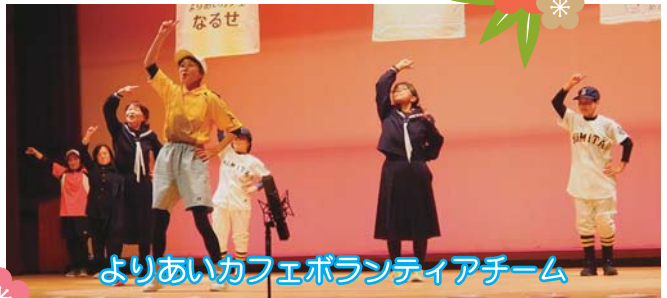
よりあいカフェボランティアチーム