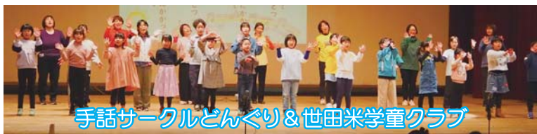
手話サークルどんぐり&世田米学童クラブ

今年度も歳末たすけあい芸能祭が開催されました！多彩なステージの一部をご紹介します！（P6に詳細記事）