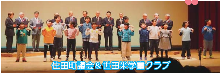
住田町議会&世田米学童クラブ