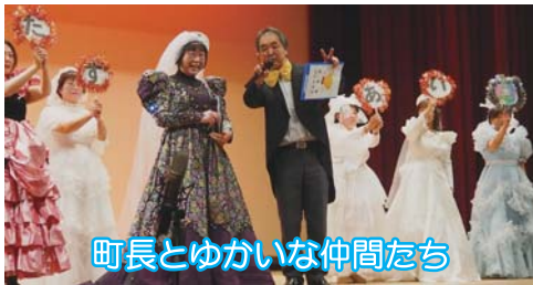
町長とゆかいな仲間たち