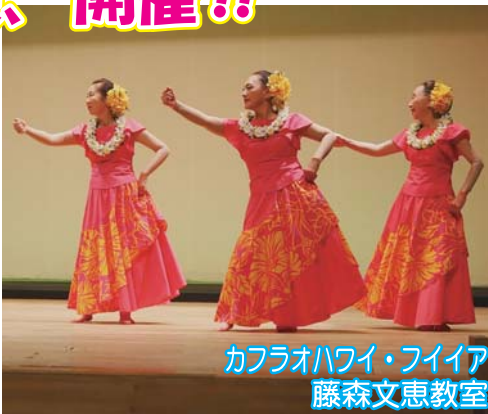
カフラオハワイ・ファイア 藤森文恵教室