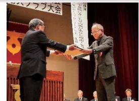
令和6年度 住田町社会福祉大会