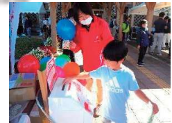
産業まつりにて赤い羽根募金運動