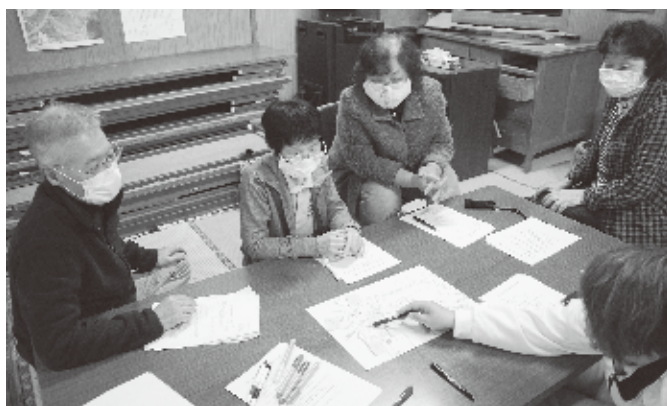
防災福祉マップ作成の様子

いざという時、あわてず避難や安否確認が出来るよう、みなさんの地区でもマップを作ってみませんか？興味のある地区は、ぜひ社協にご連絡ください。