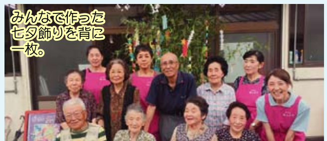
みんなで作った 七夕飾りを背に 一枚。