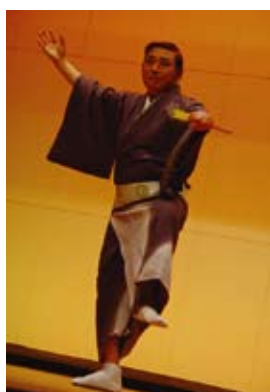
【銀杏の会】 男の夜明け