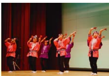
【両向婦人部】 よさこい鳴子踊り