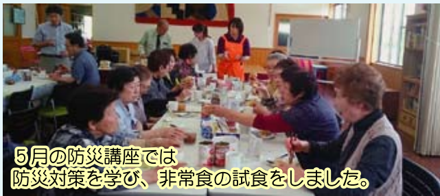
5月の防災講座では 防災対策を学び、非常食の試食をしました。