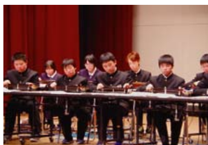
【世田米中学校総合文化部】 手のひらを太陽に、他