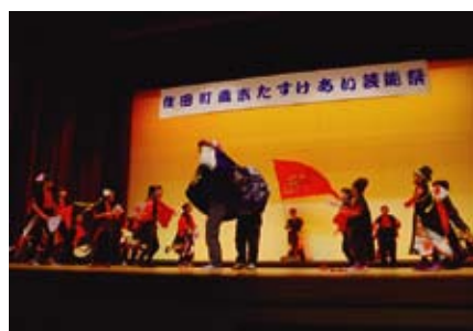
【月山よさこい鹿(shishi)】 陽の鳥