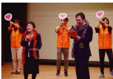
【町長とゆかいな仲間たち】 どんとこい！住田