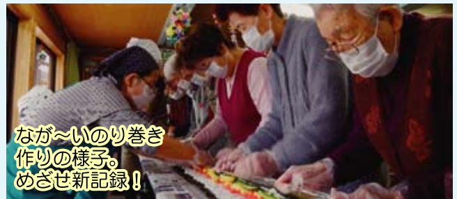
なが～いのり巻き 作りの様子。 めざせ新記録！