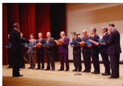
【住田町議会】 青い山脈