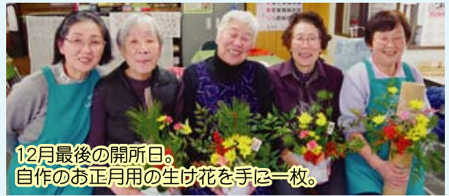
12月最後の開所日。 自作のお正月用の生け花を手には一枚。