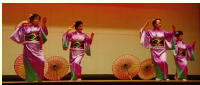
【東峰クラブ】 雨の思案橋