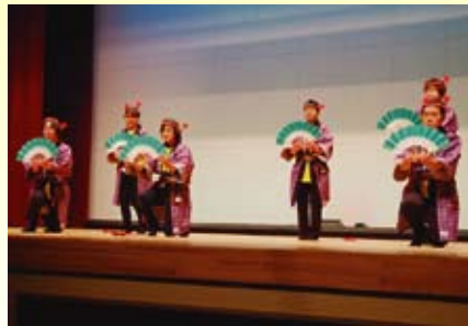
【火の土婦人部】 お祭りマンボ