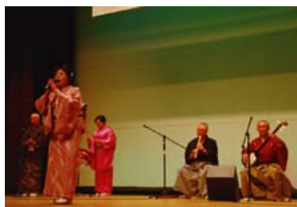
【住田三弦会】 南部俵積み唄、他