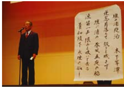
【住田吟詠会】 壇ノ浦夜泊、他