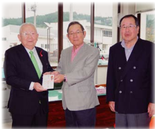
住田町ゴルフ協会の皆さん