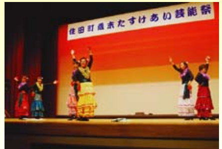
【恵山婦人部】 星のフラメンコ