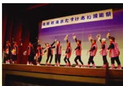
【坂本ロコモ会】 津軽のじょっぱり