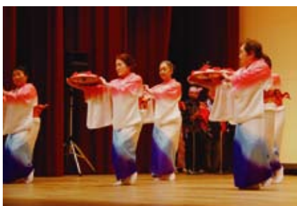
【愛宕喜楽会】 花笠音頭