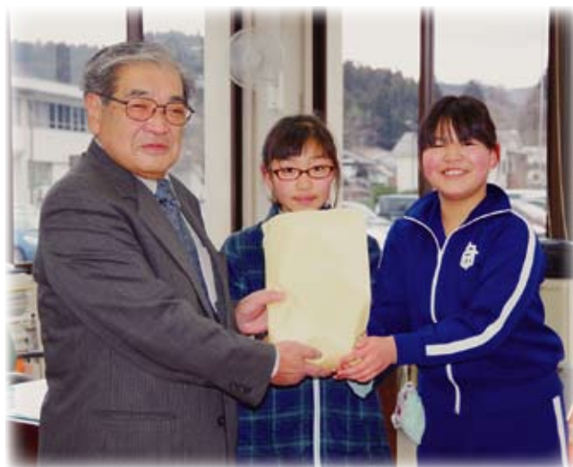
募金を届けて下さった 世田米小学校のみなさん。

お寄せいただいた募金は全額岩手県共同募金会に送金され、その後社協を通して、各小中学校や福祉団体、ボランティア団体等へ助成され、ふれあいサロンなどにも役立てられます。ご協力ありがとうございました。