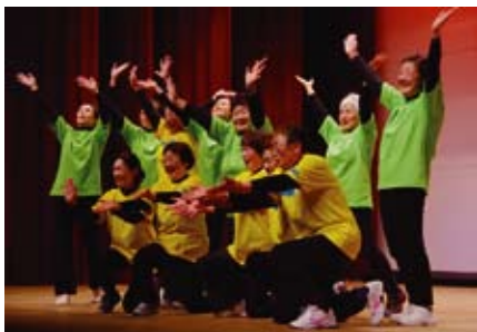
【ヘルスサポート運動教室】 好きになった人