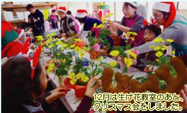
12月は生け花教室のあと、 クリスマス会をしました。