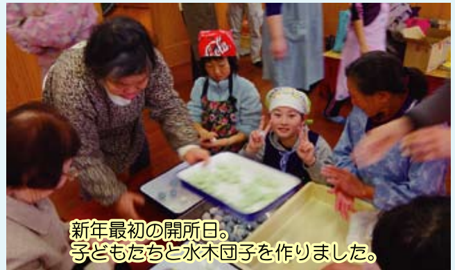
新年最初の開所日。 子どもたちと水木団子を作りました。