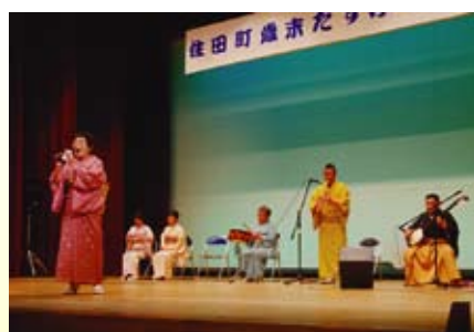
【坂本民謡会】 岩手節、他