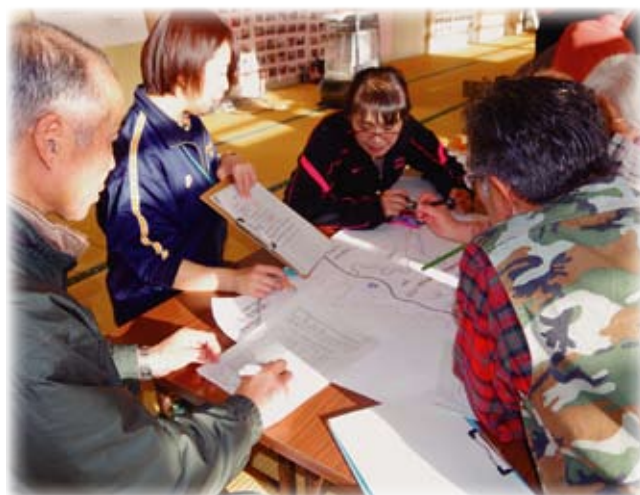
防災福祉マップ作成中の様子。

社協では今後も各地区の要望に沿って防災福祉マップ作成事業を実施していく予定です。ご希望の地区がある場合にはぜひ社協へお声がけください。