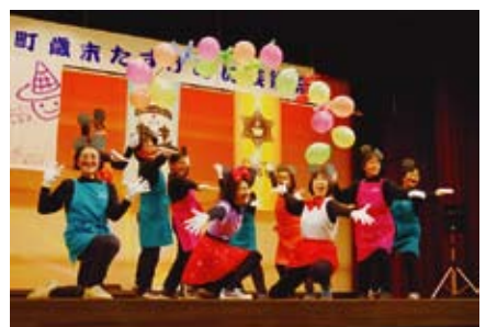
【よりあいカフェ】 ミッキーマウスマーチ