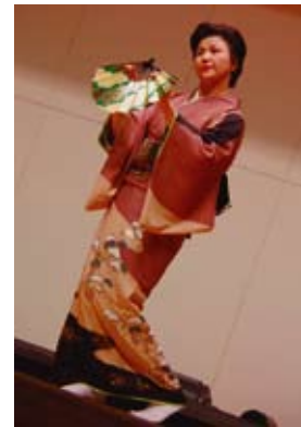
【銀杏の会】 おんなの嘘