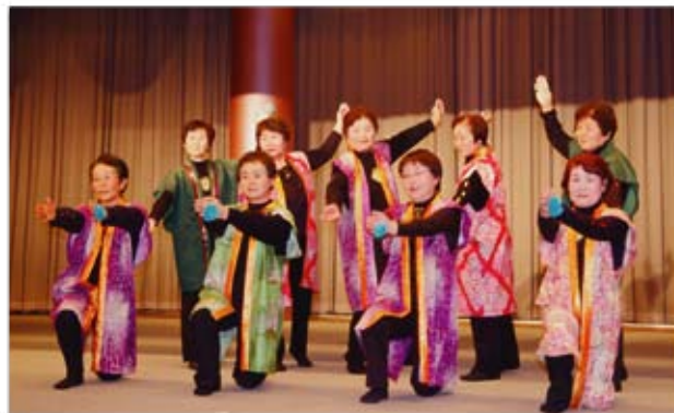
初参加者が最も多かった川口クラブ。 華やかなダンスを披露されました！

みなさん2泊3日の旅を心ゆくまで楽しみ、笑顔の絶えない3日間となりました。来年もぜひご参加ください。