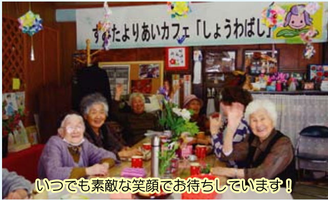
いつでも素敵な笑顔でお待ちしています！