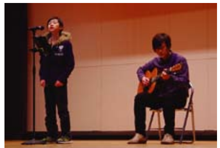
【SUMITA音楽サークル「音蔵」】 癒しのメロディー