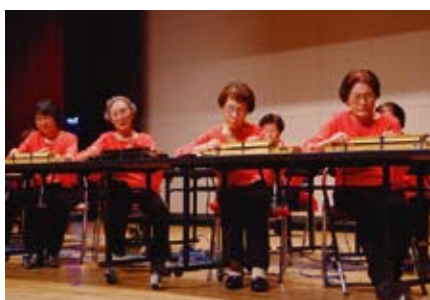
【すみたかっこ花の会】 テネシーワルツ、他