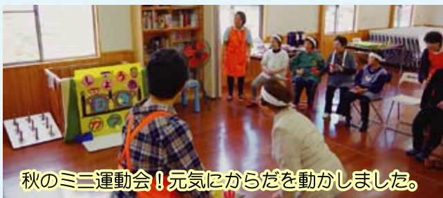
秋のミニ運動会！元気にからだを動かしました。