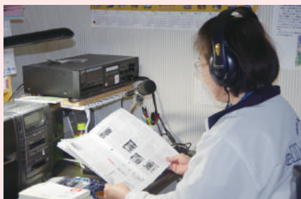
【音声訳ボランティア りぼん】