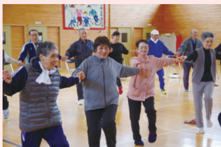
【民生児童委員協議会】