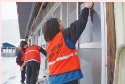
【すみたおたすけ隊】