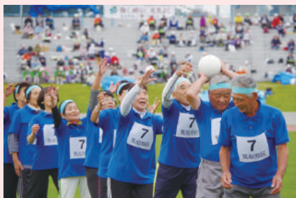
【老人クラブ連合会】