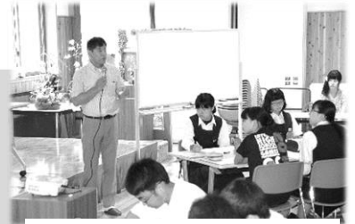
【ボランティア養成講座には中高生も参加】