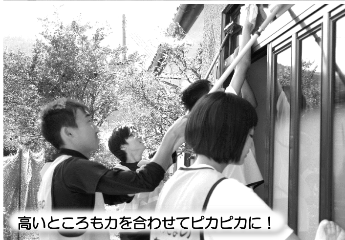
高いところも力を合わせてピカピカに！

ボランティア活動連絡会が呼びかけ、町内の中高生たちが中心となって行うボランティア活動『すみたおたすけ隊』。昨年引き続き、夏休みを利用してひとり暮らし高齢者宅の窓ふきボランティアを行いました。