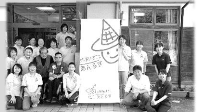
【中心型よりあいカフェ『あんるす』を開所しました】