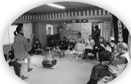
寒倉ふれあいサロンの様子