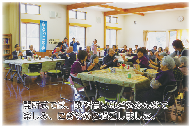
開所式では、歌や踊りなどをみんなで楽しみ、にぎやかに過ごしました。