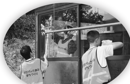
すみたおたすけ隊・ボランティアの日の活動の様子

赤い羽根共同募金助成事業では、みなさまからいただいた募金を活用し、高齢者、障がい者、児童、ボランティア、サロン活動など、さまざまな分野で助成を行い、町内の地域福祉活動の推進に役立てられています。