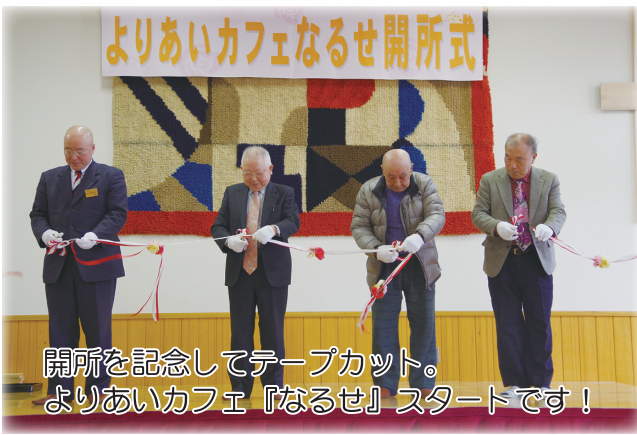
開所を記念してテープカット。 よりあいカフェ『なるせ』スタートです！