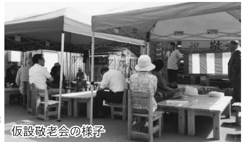
仮設敬老会の様子

参加者同士の交流会や、転居した方との同窓会などを開催し、親睦を深め情報交換する場を作ることができました。ありがとうございました。