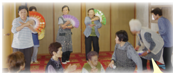
【あけぼのカフェ】 元気に踊りっこも披露します！