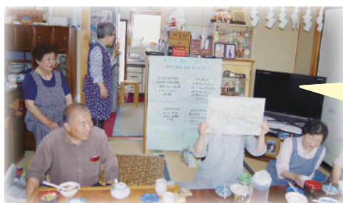
【あたごカフェ】 「こんな町にしたい！」も語り合います

すみたよりあいカフェは、現在中心型のカフェ「しょうわばし」と地域型12カ所が運営されています。地域型カフェは地域の方による運営で、申請により社協から1回当たり1,000円の助成金を受けることができます。