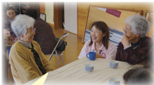
【ひまわりカフェ】 仲良くはなすかだりしています

よりあいカフェは誰もが気兼ねなく寄り合える居場所を設置することにより、介護予防と社会参加を推進するもので、現在実施されているカフェでは、地域の特徴に合わせて、毎回楽しく開催され、参加者の心のよりどころとなっています。