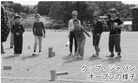
カップ・ジャパン オープンの様子

国体のデモンストレーション競技であるカップを通して、楽しく交流することができました。ありがとうございました。