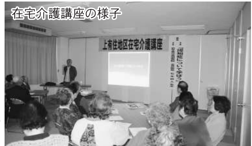
在宅介護講座の様子

地区ごとに交流会や防災用品の配布など、地域の皆さんが安心して楽しく暮らせるために活用しました。ありがとうございました。