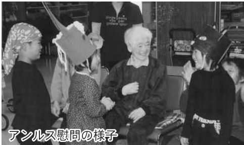
アンルス慰問の様子

おかげさまで社会奉仕への関心を深めたり、地域の方との交流を楽しむことができました。ありがとうございました。