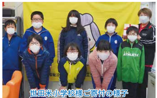
世田米小学校様ご寄付の様子