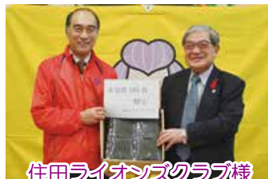
住田ライオンズクラブ様 非常食ご寄付