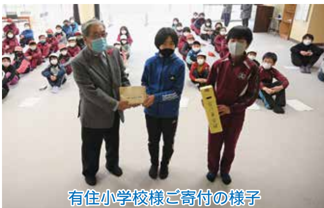
有住小学校様ご寄付の様子