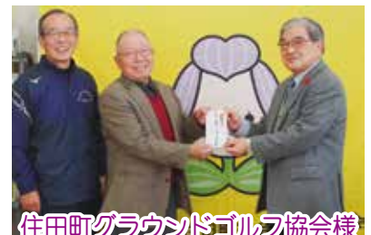
住田町グラウンドゴルフ協会様 ホールインワン募金ご寄付