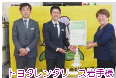
トヨタレンタリース岩手様 消毒液スタンドご寄付