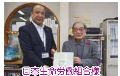
日本生命労働組合様 ハッピーサポートカタログご寄付