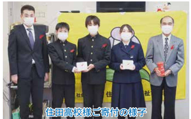
住田高校様ご寄付の様子

赤い羽根共同募金運動や歳末たすけあい募金運動に伴い、学校で集められた募金を、町内の各学校様（世小、有小、住高）から住田町共同募金委員会にご寄付いただきました。ありがとうございました。