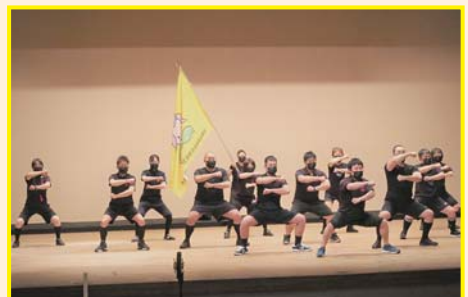
【住田町社会福祉協議会】 ハカ

歳末たすけあい芸能祭は、赤い羽根共同募金「歳末たすけあい募金運動」の一環として、出演者・スタッフ・来場者が一体となって開催されています。今回は約200人あまりの方々から前売り・当日のチケット購入による募金にご協力いただきました。チケットの売上金92,500円は全額住田町共同募金会へと寄付され、町内の福祉活動に役立てられます。