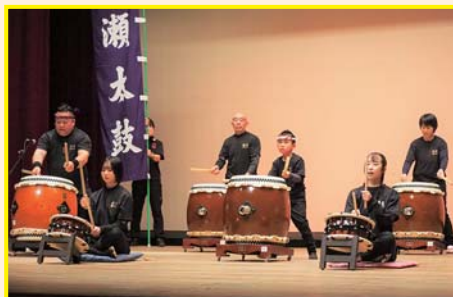
【鳴瀬太鼓】 海潮音 他