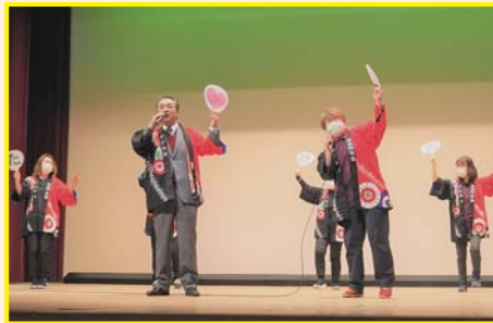
【町長とゆかいな仲間たち】 どんとこい! すみた