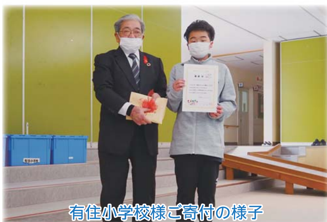
有住小学校様ご寄付の様子