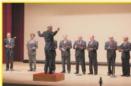
【住田町議会】 北国の春