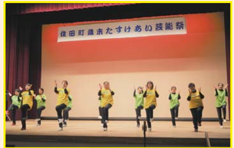
【ヘルサポートの会】 高原列車は行く