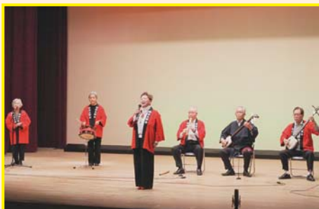
【住田三弦会】 津軽甚句 他