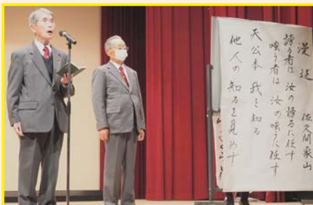
【住田吟詠会】 山桜 他