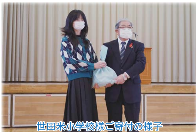
世田米小学校様ご寄付の様子

赤い羽根共同募金運動や歳末たすけあい募金運動に伴い、学校で集められた募金を、町内の各学校様（世小、世中、有小、住高）から住田町共同募金委員会にご寄付いただきました。ありがとうございました。