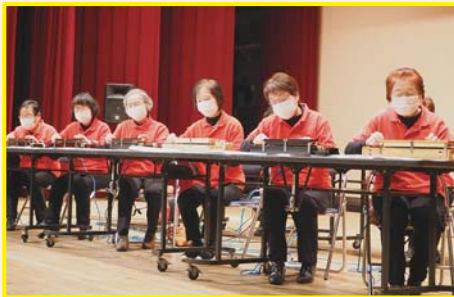
【すみたがっこ花の会】 瀬戸の花嫁 他

12月4日(日)に歳末たすけあい芸能祭が開催されました。開催時間の短縮や観覧席数の半減等、新型コロナウイルス等感染症対策を実施しながら、多種多様なステージで盛り上がりました!