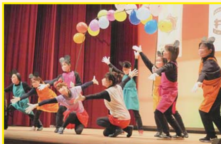
【よりあいカフェ】 ミッキー・マウスマーチ