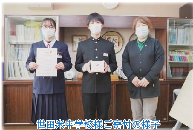
世田米中学校様ご寄付の様子