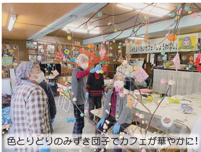
色とりどりのみずき団子でカフェが華やかに!

よりあいカフェ1月のイベントデーでは、「みずき団子作り」を行いました。 願いを込めたみずき団子を丁寧に飾り付け、五穀豊穡を祈願しました。