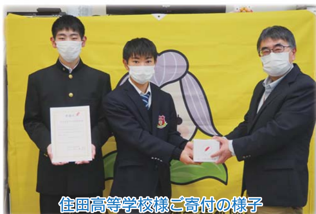
住田高等学校様ご寄付の様子