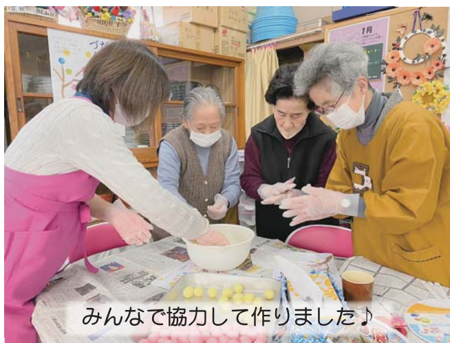
みんなで協力して作りました♪