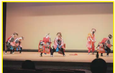
【愛宕喜楽会】 急佛剣舞